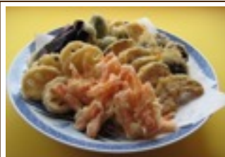
精進揚げ盛合わせ 2,200円~ (写真は4,400円)