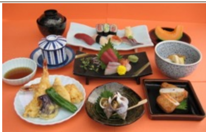
寿司会席料理コース 4,400円~6,600円 (写真は5,500円)