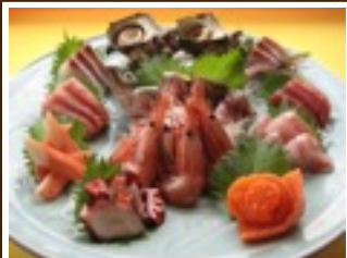
刺身盛合わせ 3,300円~ (写真は9,900円)