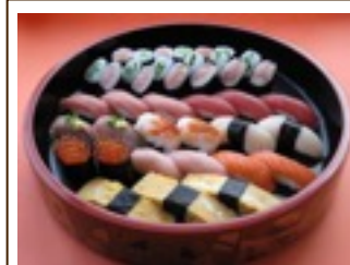
上寿司盛合せ (三人前) 6,900円