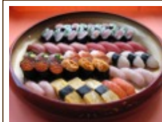
上寿司盛合せ (五人前) 11,500円