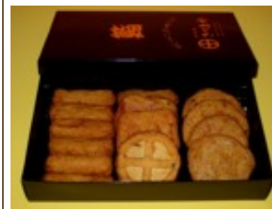
1,100円・2,200円・3,300円 (写真は2,200円)