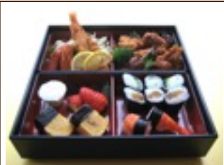
お子様弁当 (要予約) 2,200円