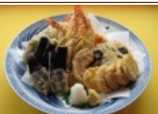
天ぷら盛合わせ 3,300円~ (写真は6,600円)