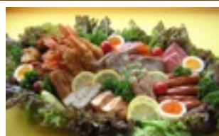
洋風オードブル (要予約) 7,700円