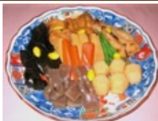
筑前煮 (要予約) 3,300円