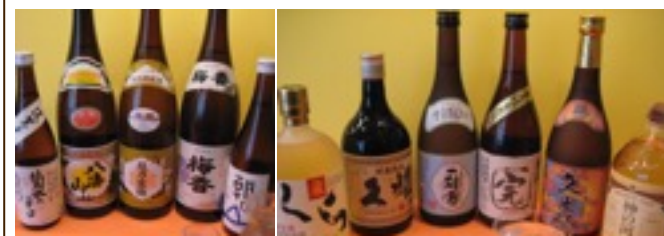
日本酒・焼酎・ビール・サワー ウイスキー・ソフトドリンク 330円~