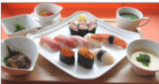
特上にぎり寿司セット(珈琲付) 4,600円 (とんこつは薩摩揚げに変更)