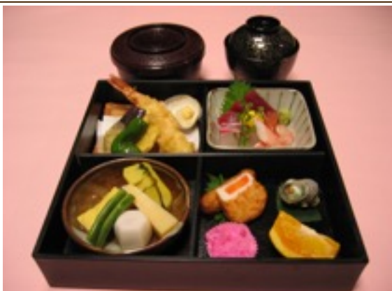
松花堂弁当 3,300円~5,500円(写真は3,300円)